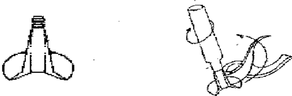
Figura 1.- Prueba de adhesión de válvulas para rin