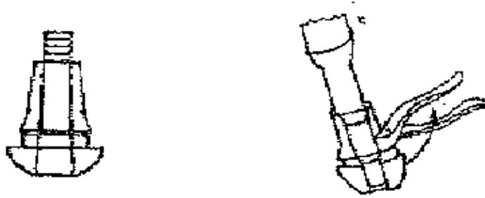
Figura 3.- Prueba de adhesión de la válvula para rin