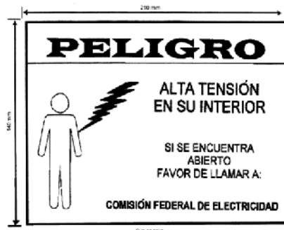
Referencia de los colores requeridos